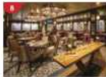
Bistro By Mark Best Relish contemporary Western cuisine from the internationally-acclaimed Australian chef.