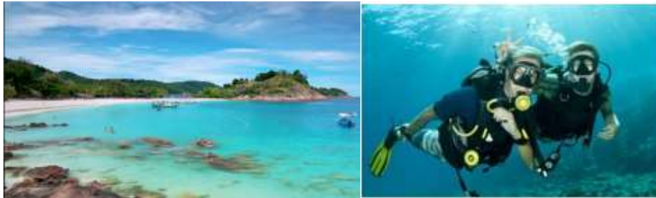
โปรแกรมและราคา อาจมีการเปลี่ยนแปลงได้จากทางเรือสำราญโดยไม่ต้องแจ้งให้ทราบล่วงหน้า

** ตัวอย่าง ทัวร์เรดิง จะเป็นทัวร์พาไป Scuba Driving แบบไม่ลึกพาไปดำน้ำในจุดที่ปะการังสวยที่สุดในเกาะเรดิงและเหมาะสำหรับท่านที่ฝึกหรือเพิ่งจะดำน้ำระยะเวลาในการดำน้ำ 2 ชั่วโมง ซึ่งจะมีอุปกรณ์ให้บริการรวมถึงวีดีโอแนะนำและเตรียมตัวก่อนลงดำน้ำ (ท่านจะต้องแน่ใจว่าสุขภาพท่านแข็งแรงพร้อมที่จะร่วมกิจกรรมดำน้ำทัวร์นี้ไม่เหมาะสำหรับสตรีมีครรภ์ และเด็กอายุต่ำกว่า 8 ปี เด็กอายุระหว่าง 8-11 ปีต้องอยู่ในความดูแลของผู้ปกครอง) **