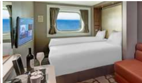
Ocean view Room